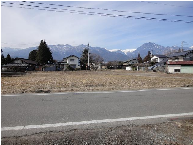
東側公道からの西方向の全景（造成工事前の写真）

JR 大系線「有明駅」の西約 1,200m の田園に囲まれた閑静な集落の一角。小学校 620m、保育園・中学校 1,500m、コンビニ 770m、スーパー車で 4 分・1,700m など、子育てや生活環境に恵まれています