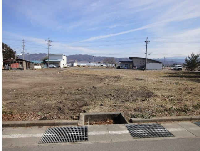
西側公道から東方向の全景（造成工事前の写真）