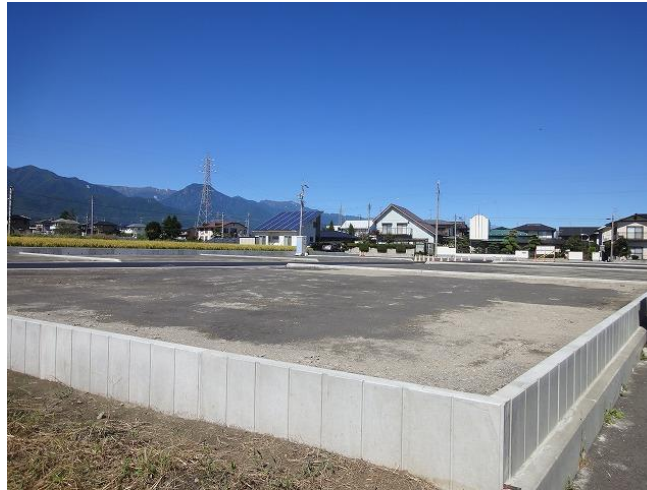
分譲地南東隅から北西方向です。