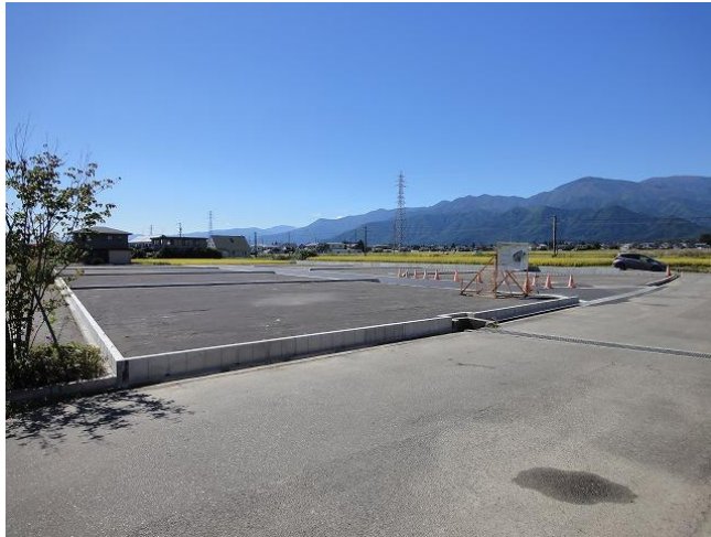
分譲地北東隅からの全景です

この分譲地は JR 穂高駅と柏矢町駅のほぼ中間、田園風景と北アルプスが望める住宅街の一角にあります。また、JR 駅や国道沿線の商店街、小学校や中央図書館などに近く、生活環境にも恵まれています。